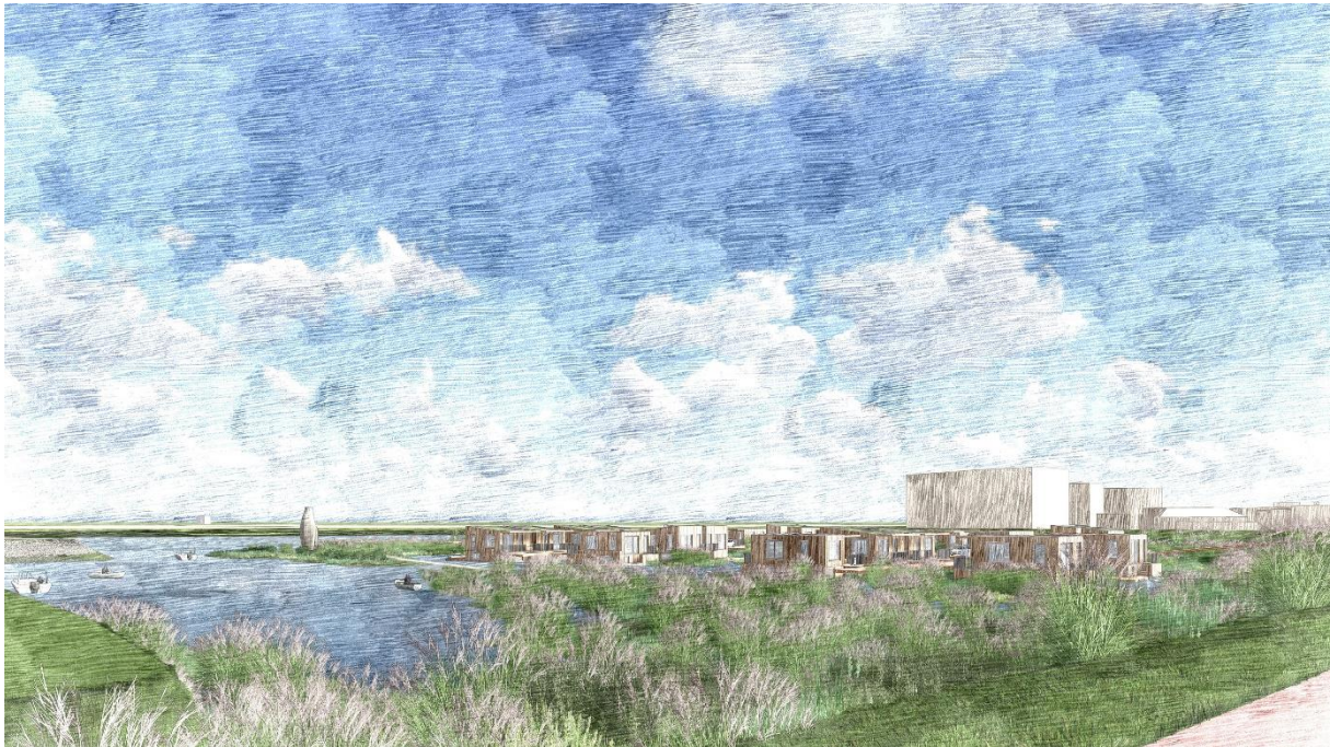
3D-Impresie zicht vanaf de dijk, drijvende woningen in het Rietgors

Gedurende het proces zullen wij u via de nieuwsbrief en website op de hoogte houden van de ontwikkelingen.