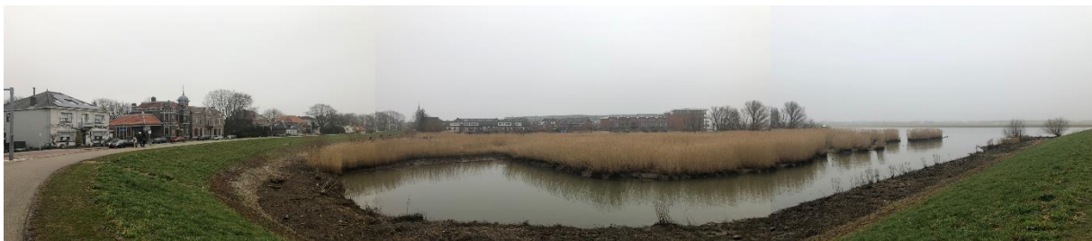
Het Rietgors gezien vanuit de hoek Cortgene-Rivierstaete

U heeft zich opgegeven als geïnteresseerde betreffende het initiatief van het Rietgors aan het Cortgene te Alblasserdam. Nu de eerste informatieavond voor omwonenden en belanghebbenden is geweest, willen we u graag door middel van deze nieuwsbrief op de hoogte houden van de ontwikkelingen. Ook is er een website gelanceerd waar u alle beschikbare informatie kunt vinden: www.drijvendwonenalblasserdam.nl