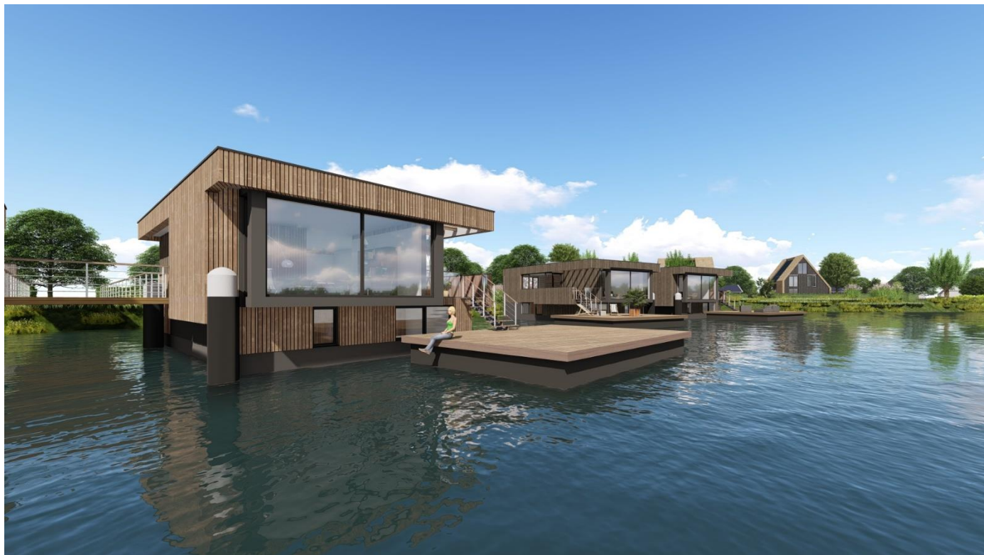
Impressie waterwoningen en grondgebonden woningen Oeverzwaluwplas

Mocht u aan de hand van deze nieuwsbrief vragen of wensen hebben, neem dan contact met ons op via info@balancedeau.nl