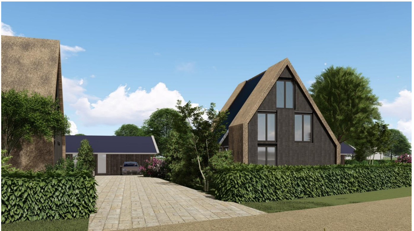
Impressie ontwerpconcept grondgebonden woningen met kangoeroefunctie

Er is veel belangstelling voor het project, maar omdat het project zich nog in de bestemmingsplanfase bevindt, is alle informatie die wij u toesturen nog wel onder voorbehoud.