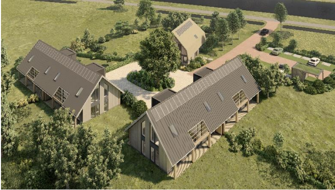
Impressie Weidezicht oost

Deze woning is speciaal ontworpen om een ouder of kind die verzorging nodig heeft, toch een geheel eigen zelfstandige woning te bieden. In het bijgebouw is tevens een extra berging of zelfs een overdekte parkeerplek voor 2 auto's opgenomen.