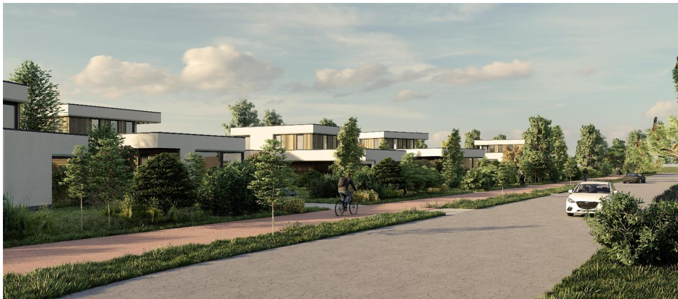
Impressie vrijstaande woningen Weidezicht West

Ook vindt u hier de concept ontwerpen en plattegronden van de verschillende woningtypen. Tevens kunt u alle voorgaande edities van de nieuwsbrieven lezen en de nieuwsberichten over dit project.