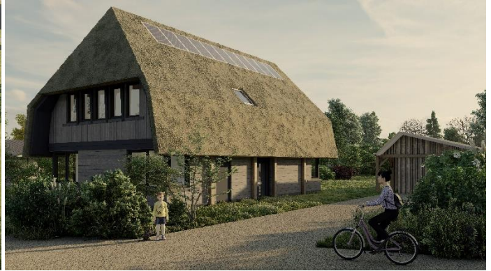
Impressie kangoeroewoning Oeverzwaluwplas