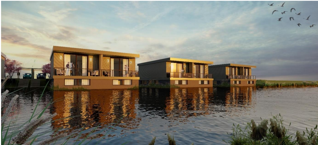
Impressie Royal Waterlofts vanuit de Blauwe Diamant

Triodos bank Adviseur: Dirk Bugter T 030-6942383 M 06 -36020487 E dirk.bugter@triodos.nl